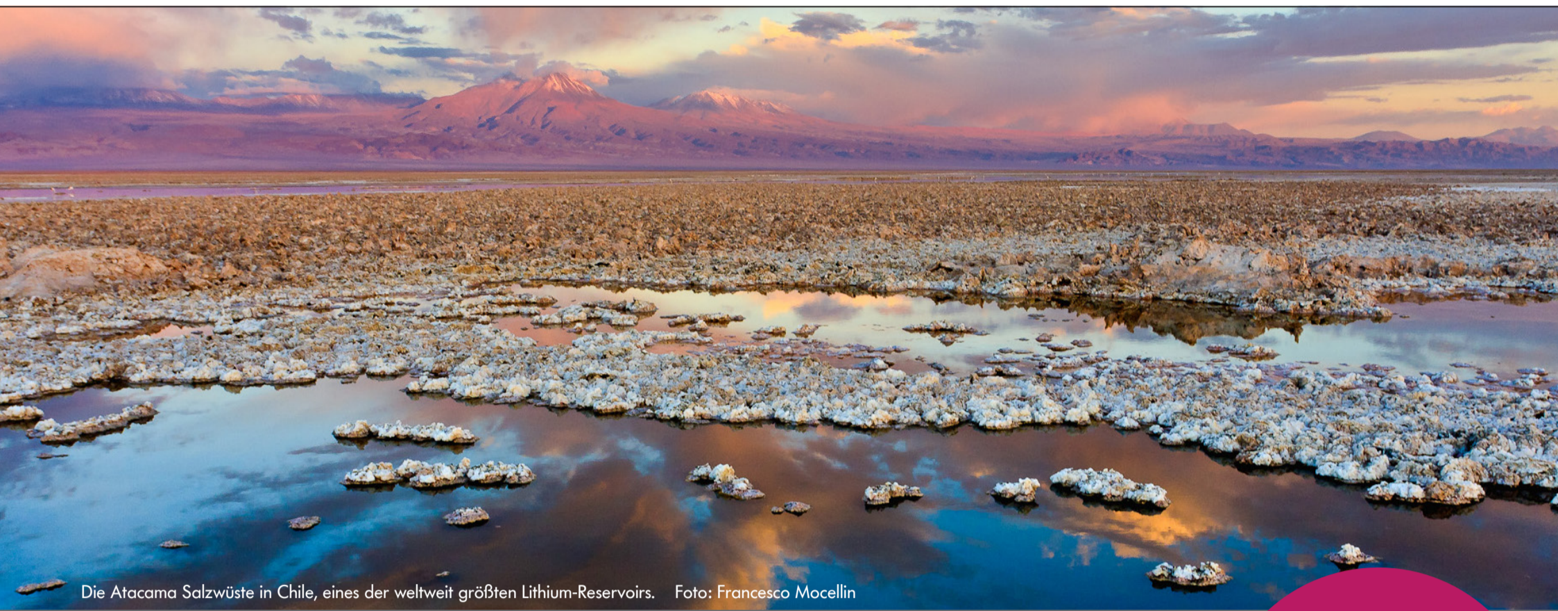
Die Atacama Salzwüste in Chile, eines der weltweit größten Lithium-Reservoirs.

Beginn um 16 Uhr; Ort: Seminarraum Forschung 1 oder online Informationen hier: https://www.deutsches-museum.de/forschung/forschungsinstitut/vortragsreihen/montagskolloquium